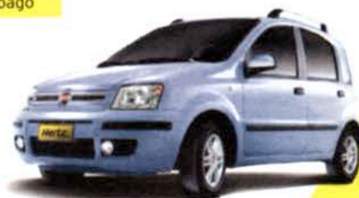
Italia | Auto Económico* | Fiat Panda

Reservas internacionales 2754-6850 Arriendos dentro de Chile 2360-8666