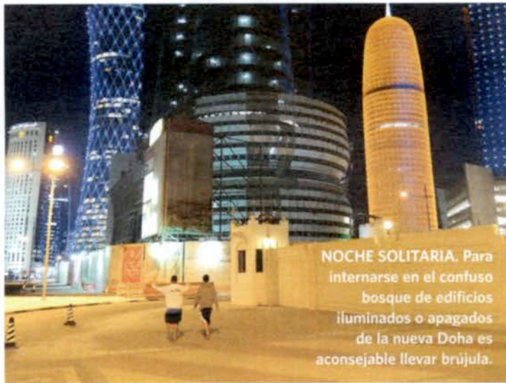
NOCHE SOLITARIA. Para internarse en el confuso bosque de edificios iluminados o apagados de la nueva Doha es aconsejable llevar brújula.

Time con un ropón negro, una abaya , y un velo que le cubre cabeza y cuello.