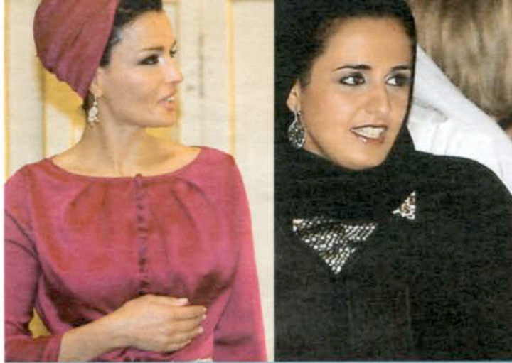
JEQUESAS. La reina, Mozah bint Nasser, y la princesa Al Mayassa bint Hamad bin Jalifa al Zani, una de las mujeres "titanes" de Time .

Un hijo de esa jequesa "civilizada y urbana" es el monarca actual: Tamim bin Hamad al Zani cumple 34 años en los próximos días. Otro de sus hijos, la jequesa Al Mayassa, es el mayor comprador de obras de arte en Europa y Estados Unidos. Para alimentar a los museos qataríes dispone de un presupuesto de casi 3 millones de dólares anuales. Mujer de aspecto virginal y ojos tímidos, tiene la obligación de comprar piezas de mérito que resulten decentes al wahabismo, una de las expresiones más tradicionalistas del Islam, dominante entre los saudíes y también en las tribus qataríes, hoy más pragmáticas. Siguiendo el ejemplo de su madre (criada en un Egipto liberal), la joven jequesa entreabre la mente a los más tercios. Hace poco fue elegida por Time como una de las 100 personas más influyentes del mundo (entre ellas también la Presidenta de Chile), y la subclasificó en un grupo de 13 personas bajo el título de Titanes . Ella y su madre, salvo que sean maniadas en el camino, pasarán a la historia de Medio Oriente como piezas clave de la emancipación femenina. La joven jequesa avanza, pero sabe que no puede correr. Se cuida de respetar ciertas tradiciones. La vemos en el